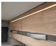
+ Meubeldecor Noce Nagano, Web Kieselgrau