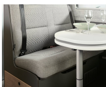
+ Bekleding Scandi