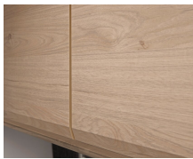
+ Meubeldecor Noce Nagano