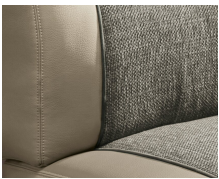
+ Bekleding Camino