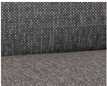
+ Bekleding Floyd