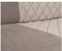
+ Bekleding Jupiter