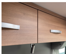
+ Meubeldecor Cape Town