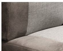
+ Bekleding Hygge