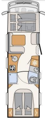
XLI 7820-2 DBM